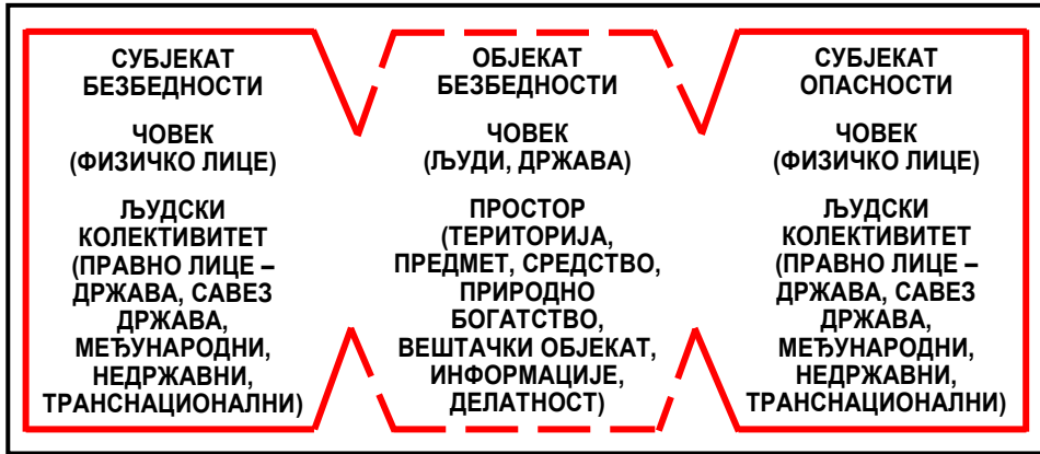
Слика 2 – Проста међузависност безбедности и опасности 49

Опасност и безбедност представљају међузависне појмове са вишеструким значењем. Уколико нема опасности не постоји ни потреба да се говори о безбедности. У том смислу прихватљиве су дефиниције безбедности које се односе на конкретан објект безбедности или су у вези са одређеном врстом опасности која угрожава нечију безбедност (слика 2). Сагледавање међузависности појмова безбедност и опасност подразумева сагледавање односа објекта безбедности (оно што је угрожено, односно оно што се штити), субјекта безбедности (онај који штити објект безбедности) и субјекта опасности (онај од кога или оно од чега се штити објект безбедности).